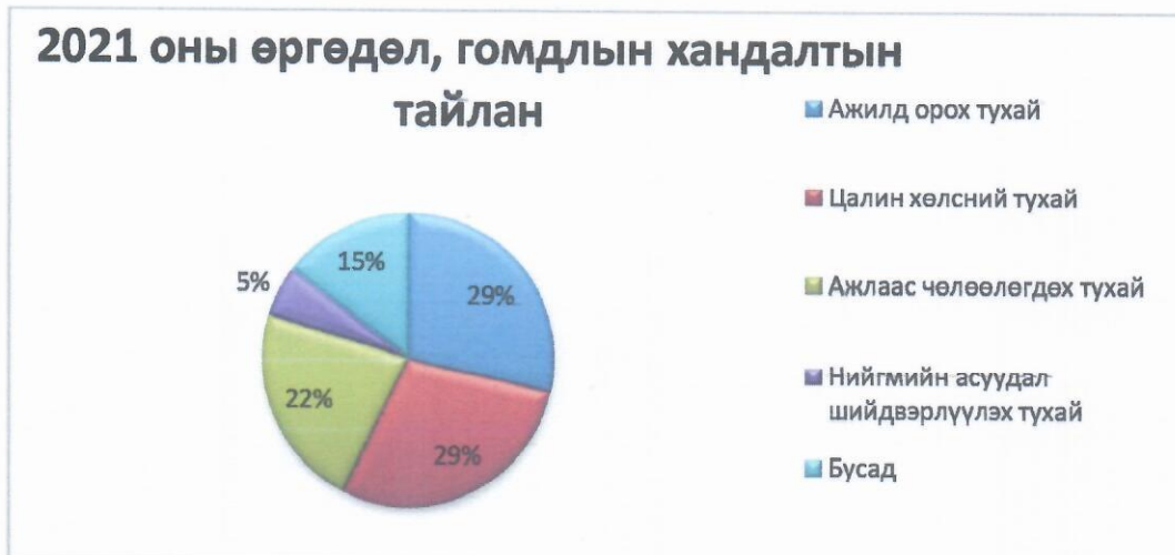
(2021 оны жилийн эцсийн байдлаар)

2021 оны жилийн эцсийн байдлаар хандалтаараа тэргүүлж байгаа 3 асуудал нь иргэнээс ажилд орох хүсэлт 41 (28,67%), цалин хөлс, цалингийн урьдчилгаа хүссэн 41 (28,67%), ажлаас чөлөөлөгдөх хүсэлт 32 (22,38%) ирсэн байна.